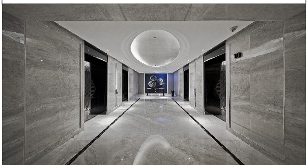
深圳遠鵬設計院：灰白色大理石鋪貼的地面、牆面，構建出低彩度的三維空間。