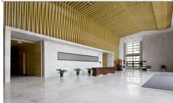
北大光華管理學院：素雅的雅高大理石和象牙塔的潔淨空間相互滲透，營造出濃鬱的書香氛圍。