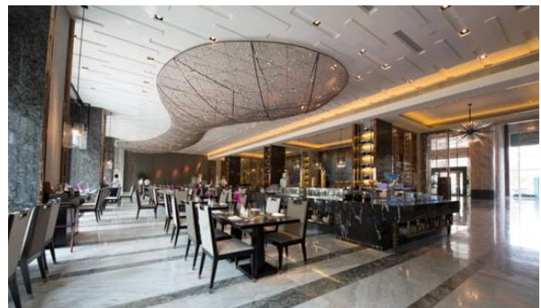
南寧萬達文華酒店：牆面、地面被雅高錦玉系列產品大篇幅渲染，營造出建築的特殊美感。