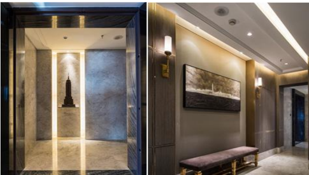
上海萬科翡翠濱江：採用雅柏灰大理石整面鋪貼，自然紋理和灰白色調營造出自然優雅空間。